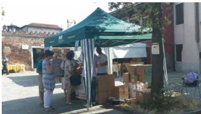
Il gazebo a Murano

Differenziata tutti i giorni, il sistema sarà esteso tra breve anche a Venezia